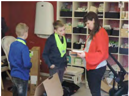
Enkele shophoppers in actie.